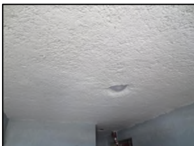
Photo N° 609 ECH-N°1 FLOCAGE -- COULOIR DE CAVE Plafonds Blanc cotonneux

Dossier n°: 2013-09-300 FK DTA PC 031LBO OPH