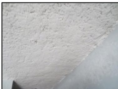
Photo N° 610 ECH-N°2 FLOCAGE -- LOCAL VELO Plafonds Blanc cotonneux